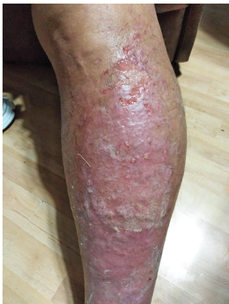
Obr. 3. Kožní změny při CVD (archiv autorky)