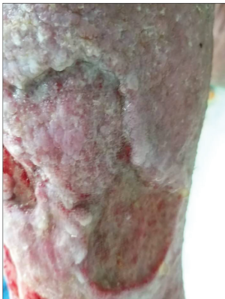
Obr. 2. Bércový vřed žilní etiologie