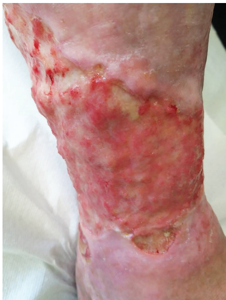
Obr. 1. Bércový vřed žilní etiologie posttrombotický